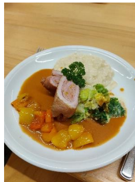
Gefüllte Schweins-Roulade an Whisky-Sauce, Rahm-Wirz Weissweinrisotto