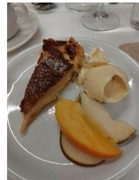
Quittenkuchen mit Ingwer Zimt-Glace