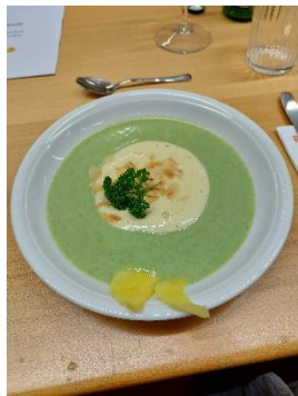
Kresseschaumsuppe mit Mangospum und Mandelsplitter