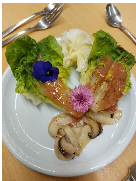
Gebratener Mini Latich mit Kase, sautierte Pilzen u Preiselbeer-Dressing