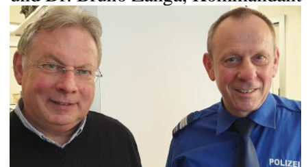
KAPO St. Gallen.