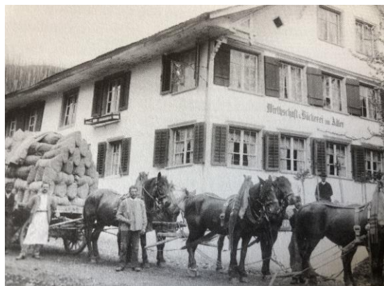
Wirtschaft und Bäckerei Adler Anlieferung des Mehl